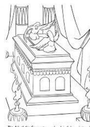
The Ark of the Covenant was placed in Solomon's temple.

Le mot Liturgie vient de deux mots grecs « laos » (peuple) et « ergon » (action), on peut donc le traduire par « service public » et « action du peuple ». En effet, la liturgie est d'abord une action. Cependant, dans la liturgie, il y a un lieu pour la non-action paisible et permanente signe d'une Présence marquée par une lumière rouge: le Tabernacle.