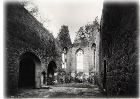
Intérieur après les bombardements