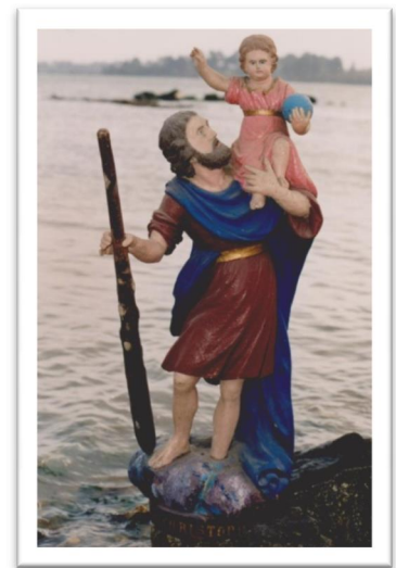
La statue de procession sculptée vers 1800

« Regarde Saint Christophe et va-t'en rassuré » (prière du Moyen Age)