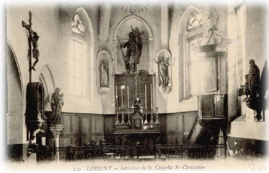
Vue Intérieure vers 1940