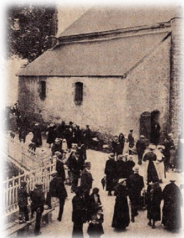
Le Pardon en 1937

Autrefois, le pardon avait lieu les lundis des trois premières semaines de mai. Les fidèles se rendaient à la chapelle pour y prier mais aussi pour demander des forces pour leurs enfants. La journée commençait par la messe (7 heures du matin), suivie de la bénédiction des enfants, des vêpres, du chapelet et s'achevait par la bénédiction du Saint Sacrement et des reliques (à partir de 1846). La tradition veut que l'on fasse également trois fois le tour de la chapelle.